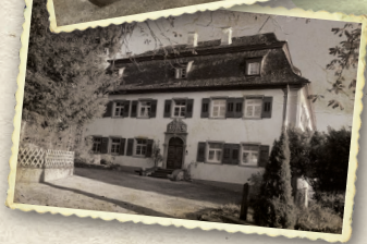
Schloss Bohlingen - ehemaliges Amtshaus und Jagdschloss