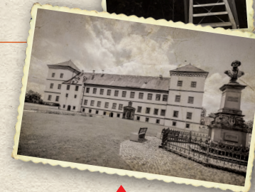
Schloss Meßkirch mit dem Oldtimermuseum in der Schlossremise