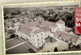
Kultur- und Museumszentrum Schloss Meßkirch